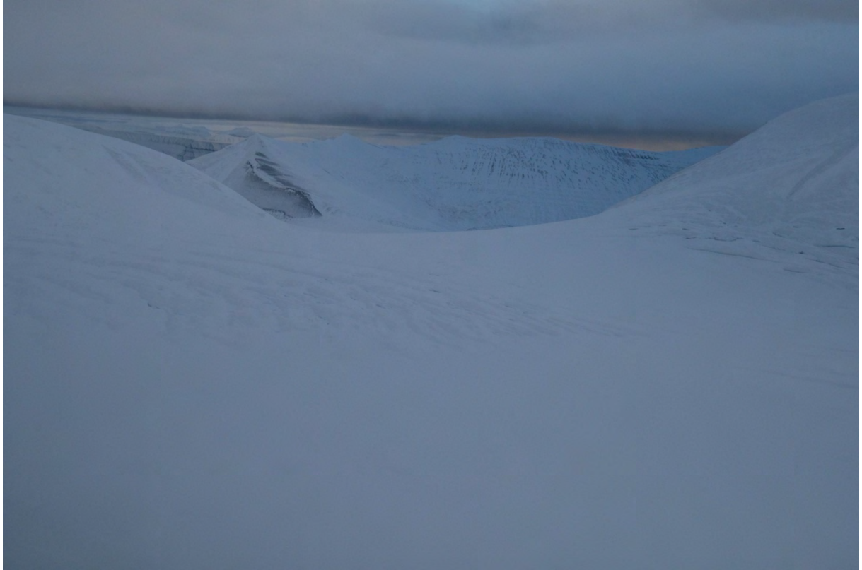
Sjaktbreen, passet sett mot sør. Fortsatt åpne sprekker i toppen.