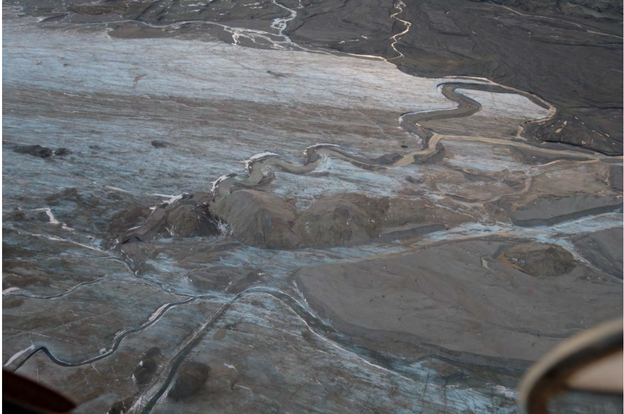
Nedre del Rabotbreen, ishule ser ut til å ha smeltet helt opp