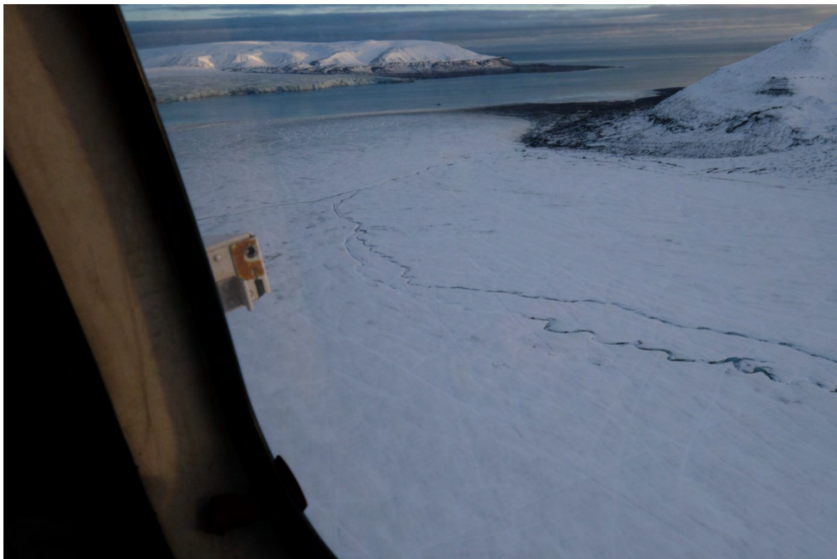
Königsbergbreen mot Mohnbukta. En del smeltevannskanaler før nedre del.