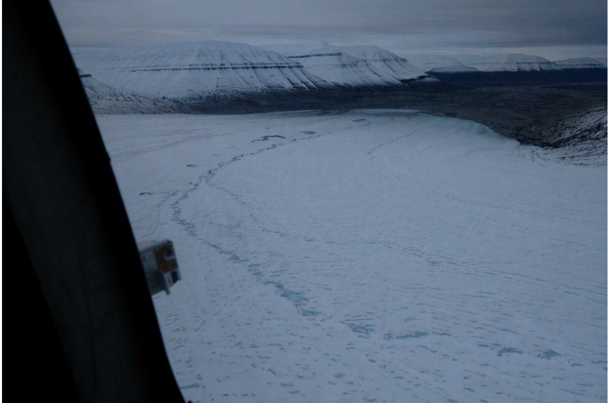
Rabottbreen nedre del, mot sørvest