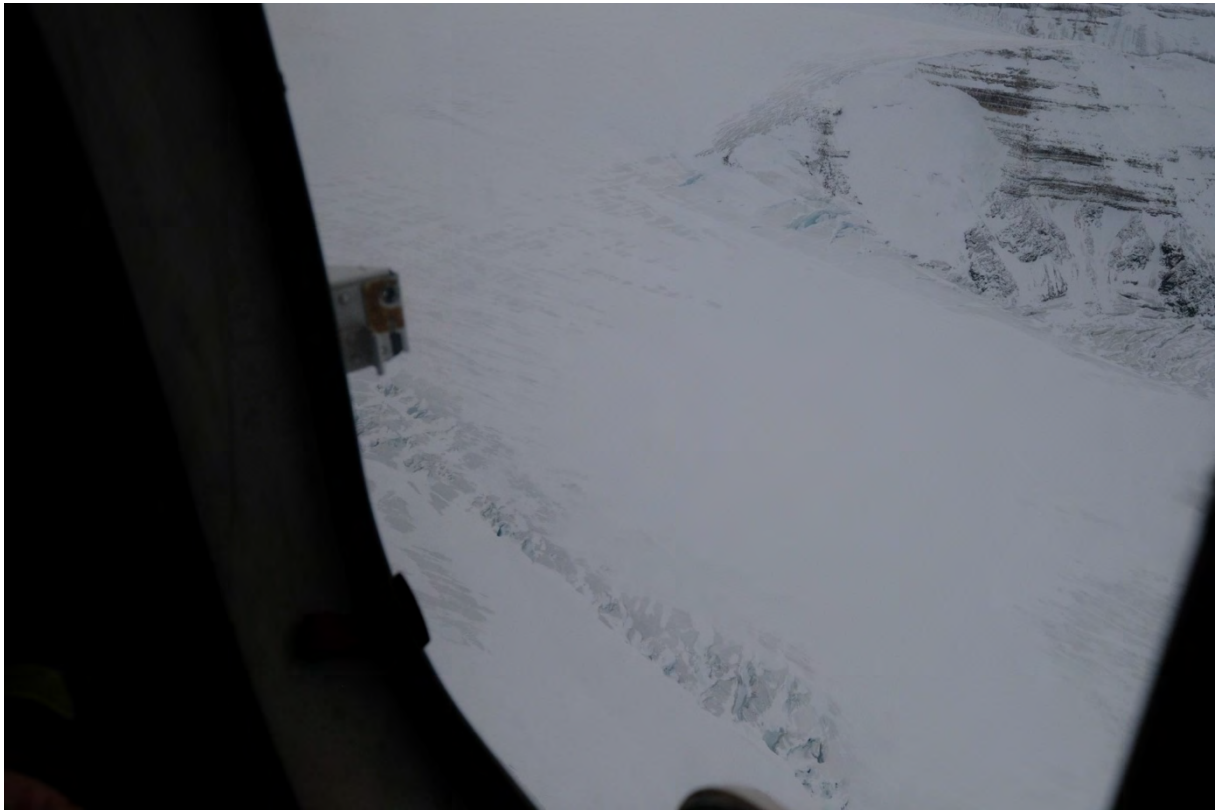
Oppkjøringen øst for Ferrierfjellet mot Filchnerfonna. Det er endel sprekker videre opp mot fonna, på toppen av Tunabreen.