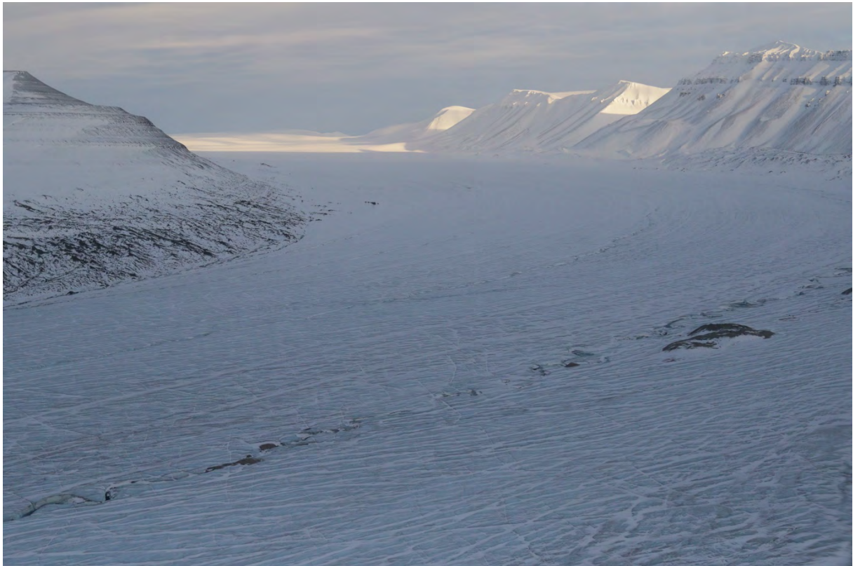
Rabotbreen nedre del, mot nord