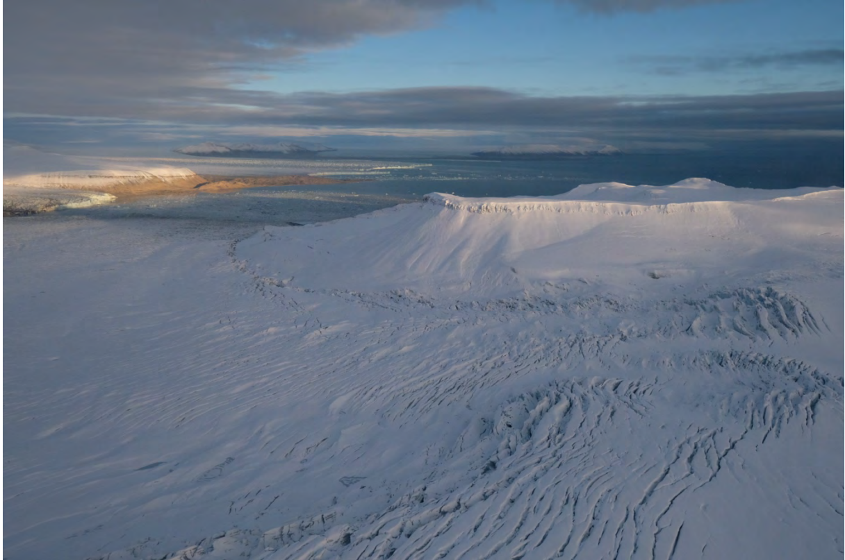
Petermannbreen mot Wichebukta