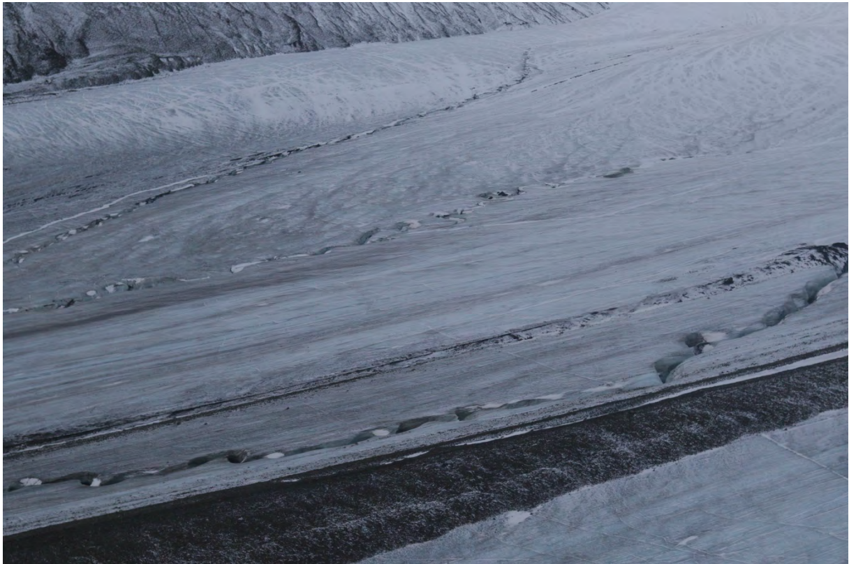
Svellnosbreen nedre del