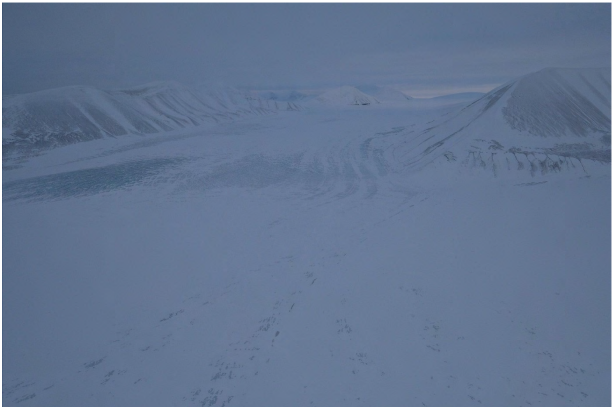
Philippbreen mot nord. Lite/ingen synlige sprekker normalruten øst opp breen. Snødekt fra ca 600moh.