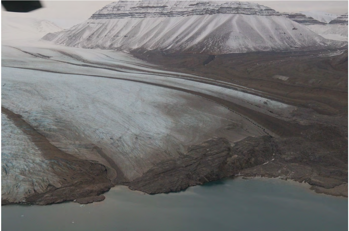
Normal oppkjøring fra Adolfbukta på Nordenskiöldbreen

Ikke flydd Ragnarbreen eller Mittag-Lefflerbreen pga lavt skydekke.