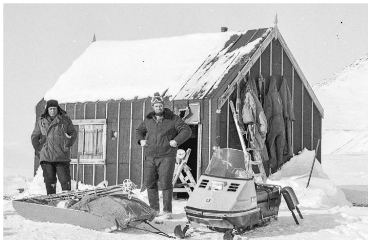
Fangststasjonen 40 år senere, ca. 1975.

Austfjordnes II blir oppført av bindingsverk med 1 1/2" spikerslag, utvendig liggende kledning som blir dekket med tjærepapp. Innvendig blir bindingsverket kledd med stående panel. Veggene og himlingen dekkes med ullpapp og spennpapp. Gulvet bygges opp med to lag gulvbord, mellom de to lagene legges aviser som vindtetting. Gulv, dører, listverk og innredning blir alle malt i samme rødbrune farge.