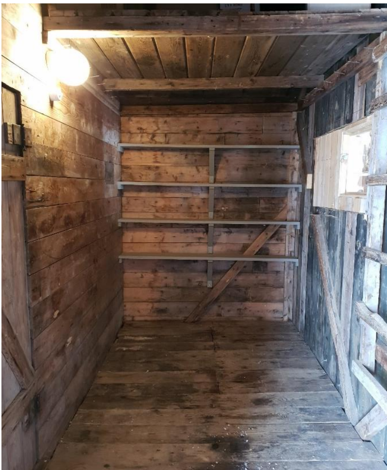
Bislaget er ryddet for nyere inndelinger og egnet som forrådsrom med supplerte hyller. Foto: SMS mai 2020