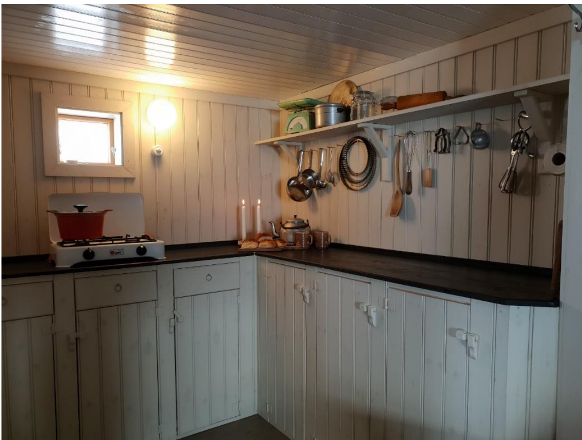
Kjøkken etter oppgraderingen.

Utbedring kjøkken og soverom var omdiskutert, og utfallet kontroversielt i forhold til de antikvariske hensynene som skal ivaretas på en fredet bygning. Tungtveiende behov fra brukerne og en antikvarisk «kompensasjon» med tilbakeføring av stua, resulterte i søknad til Riksantikvaren om nye overflater og innredning hvor formålet var å skape et nytt, praktisk interiør som underordnet seg stua slik at opplevelsen skulle harmonere. Kjøkkenet og soverommet fikk ny, linoljemalt panel, det ble lagt nytt, malt tregulv. Soverommet ble innredet med ny plassbygd 2 meter lang seng, hylle og knagger. Kjøkkenet er utstyrt med ny og praktisk kjøkkeninnredning med malte fronter, god benkeplass, hylle og belysning.