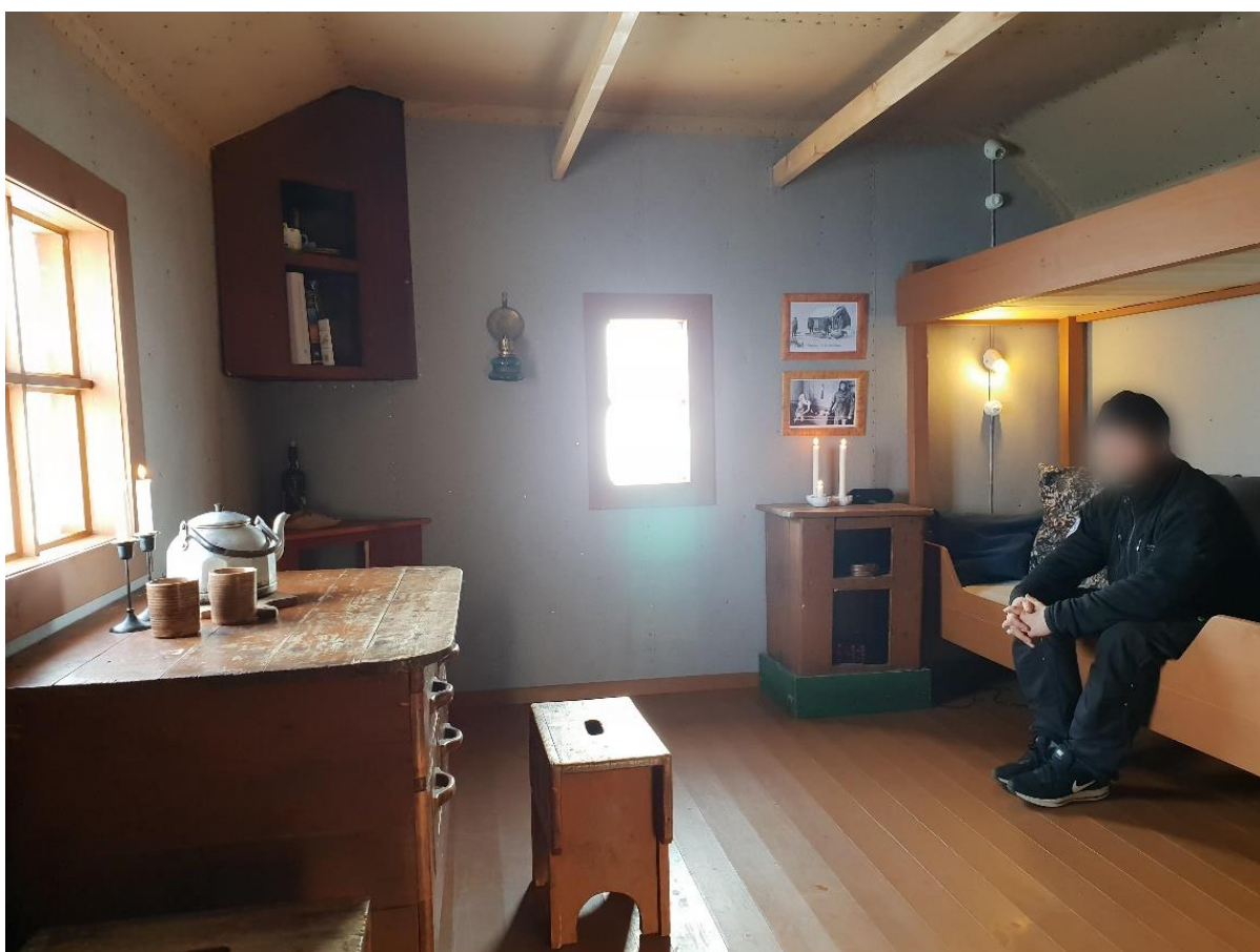
Stue med rekonstruert køyeseng.