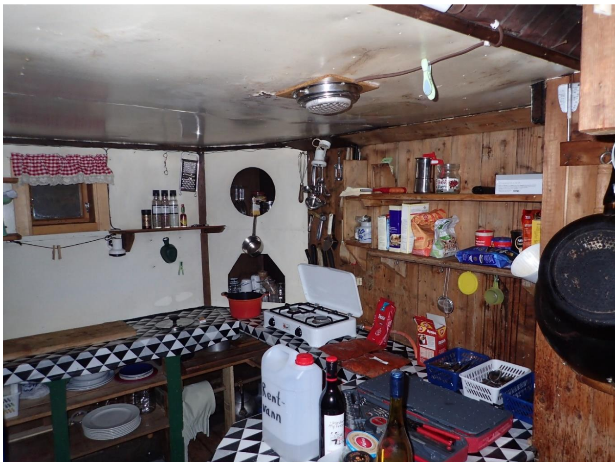
Kjøkkenhimling med fuktskader på 2010-tallet.

2017-2018 er siste sesong med overvintring på Austfjordnes før stasjonen stenges for restaurering. En teknisk tilstandsrapport tilsier omfattende råteskader og brukere som uttaler behov for bedre kjøkken- og overnattingsfasiliteter. Dette er blant momentene som utløser arbeidene i 2019-2020.