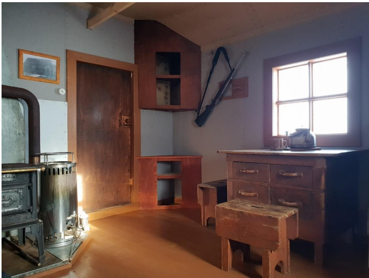
Stua etter restaureringen, med opprinnelig bord, krakker og rekonstruert nedre del av hjørneskap samt skyteglugge, Foto: SMS mai 2020.