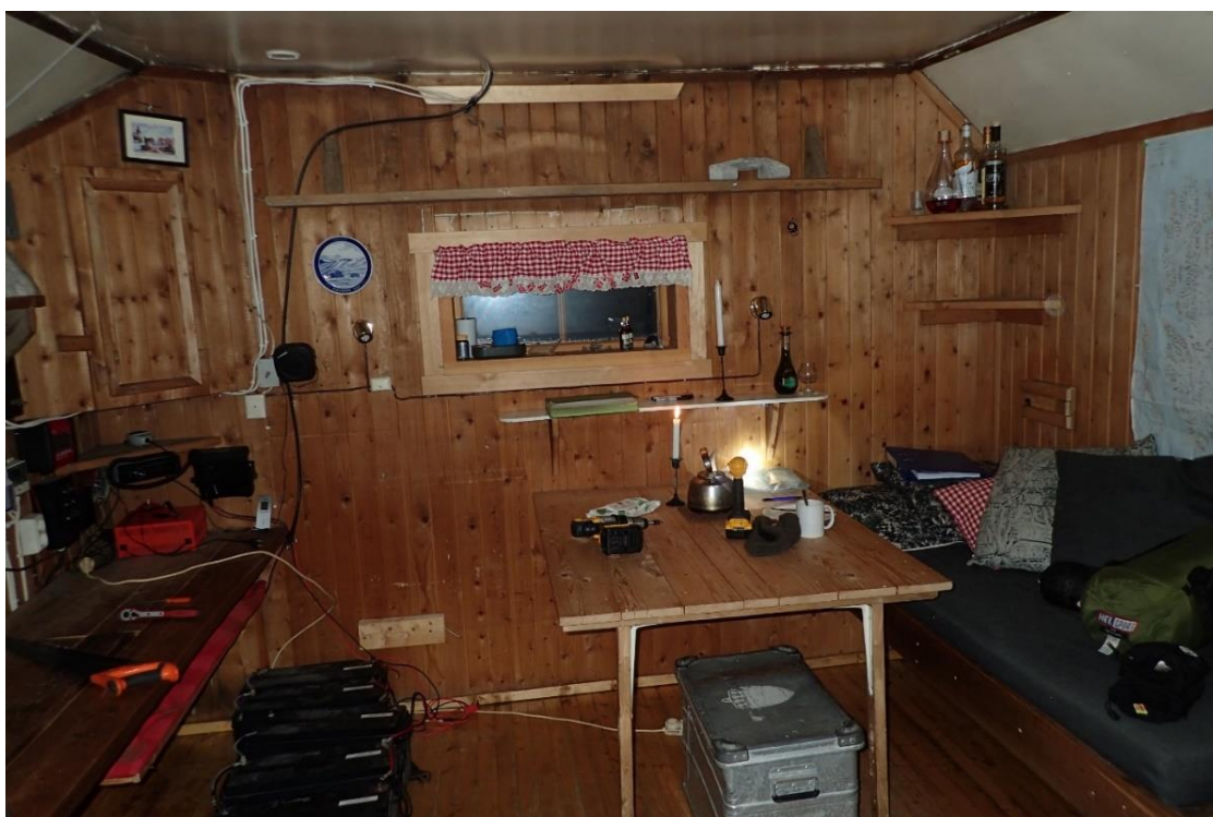
Stua i 2018, Foto SMS.

I 2002 bygges ei køyeseng i bislaget (gammelhytta). Senga på Finn Berntsen sitt soverom rives og erstattes med en ny. Parafinovnen skiftes også ut. I 2006 bygges det en frittliggende laftet badstue, og i 2007 legges det utvendig veggpapp på gavlvegg mot vest og halve langvegg mot nord. På bilde fra 2010 kan vi se at den grønne fronten på Finn Berntsen sitt kjøkken er fjernet, og kjøkkeninnredningen er supplert med en ny kjøkkenbenk som forbinder Berntsens to parallelle benker. I 2016 monteres ny vedkomfyr og vinduene skiftes. I 2017 bygges ny sengebrisk på stua.