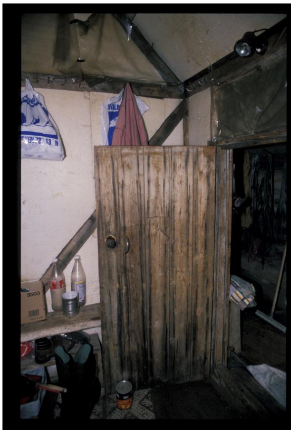
Bislaget i 2000

I 2002 bygges ei køyeseng i bislaget (gammelhytta). Senga på Finn Berntsen sitt soverom rives og erstattes med en ny. Parafinovnen skiftes også ut. I 2006 bygges det en frittliggende laftet badstue, og i 2007 legges det utvendig veggpapp på gavlvegg mot vest og halve langvegg mot nord. På bilde fra 2010 kan vi se at den grønne fronten på Finn Berntsen sitt kjøkken er fjernet, og kjøkkeninnredningen er supplert med en ny kjøkkenbenk som forbinder Berntsens to parallelle benker. I 2016 monteres ny vedkomfyr og vinduene skiftes. I 2017 bygges ny sengebrisk på stua.