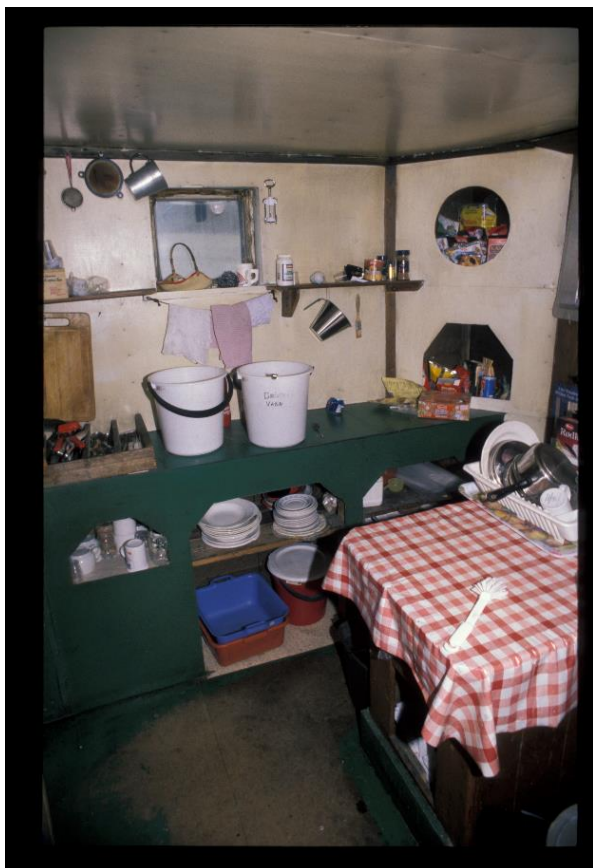
Kjøkkenet i 2000