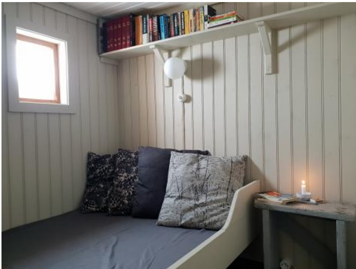
Soverom etter fornyelse. Foto: SMS mai 2020