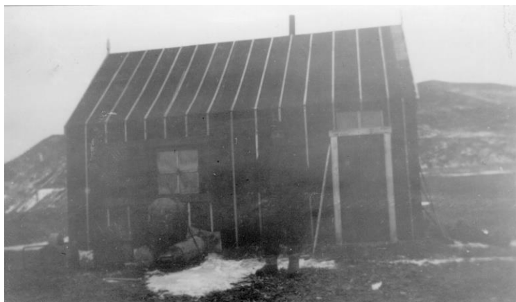
Bjørnnes sin hovedfangststasjon Austfjordnes II i 1935.

Austfjordnes II blir oppført av bindingsverk med 1 1/2" spikerslag, utvendig liggende kledning som blir dekket med tjærepapp. Innvendig blir bindingsverket kledd med stående panel. Veggene og himlingen dekkes med ullpapp og spennpapp. Gulvet bygges opp med to lag gulvbord, mellom de to lagene legges aviser som vindtetting. Gulv, dører, listverk og innredning blir alle malt i samme rødbrune farge.