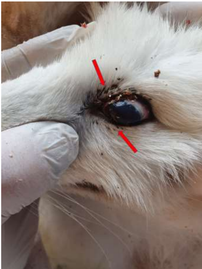
Bilde 1 og 2: viser lus rundt øyet