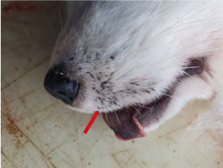
Bilde 3: viser lus rundt snute/leppe