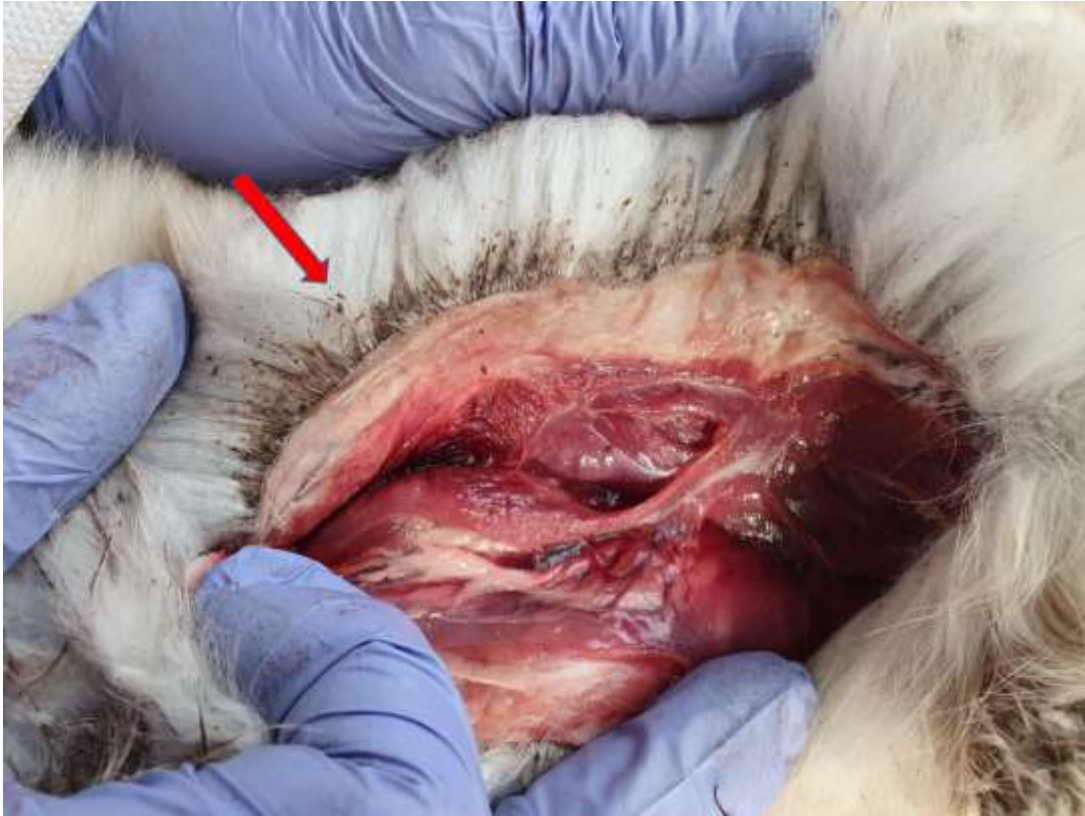
Bilde 6: viser lus som kan sees nede i pelsen generelt