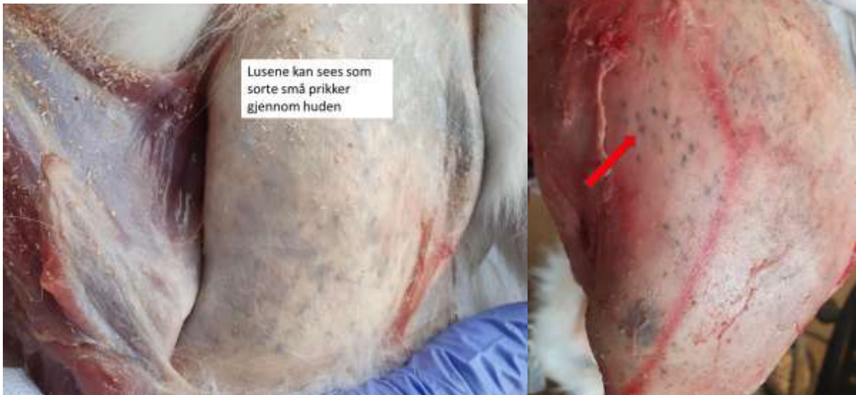
Bilde 4 og 5: viser lus som kan sees gjennom skinnet (på innsiden av skinnet etter pelsing)